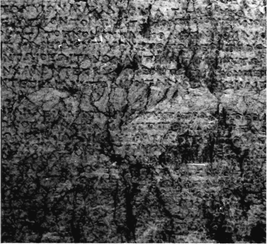
Α. Κοντογιάννης, SGI 1895 (λεπτομέρεια).