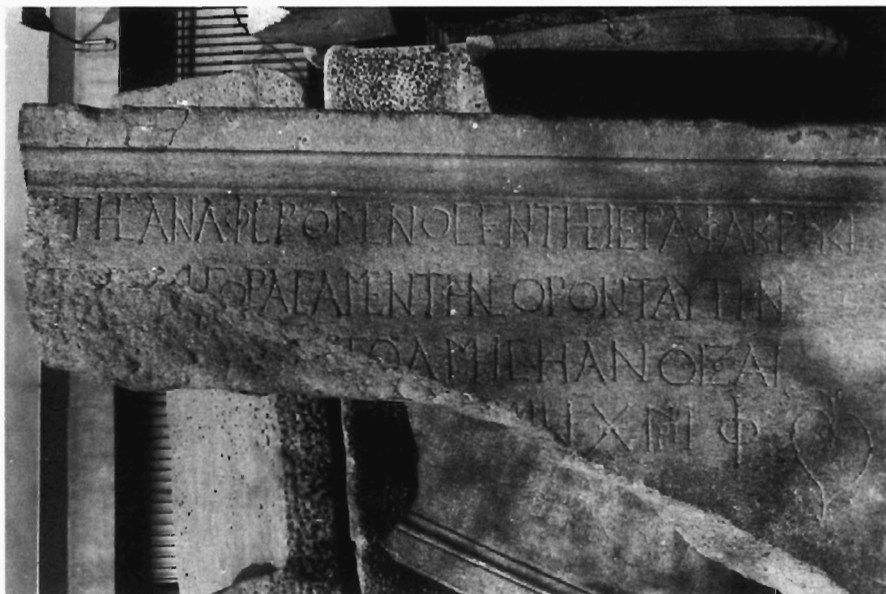
Γ. Α. Σουρής: Ἐπιγραφή σαρκοφάγου Μ.Θ., ἀρ. καταλ. 18144. Ἀπότμημα Α. (εἰκ. 2) (S. 69).