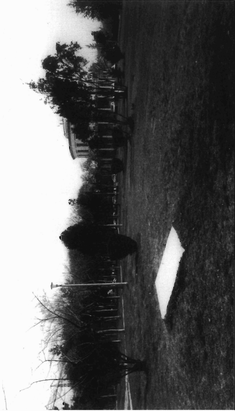
Έ. Τρακοσπολύου, εικ. 1.: Πανεπιστημιούπολη Θεσσαλονίκης, Υπαίθριος χώρος Μετεωροσκοπείου. Ένδειγμα οικοδομικό μέλος ταρξου κτίματος. (S. 130).