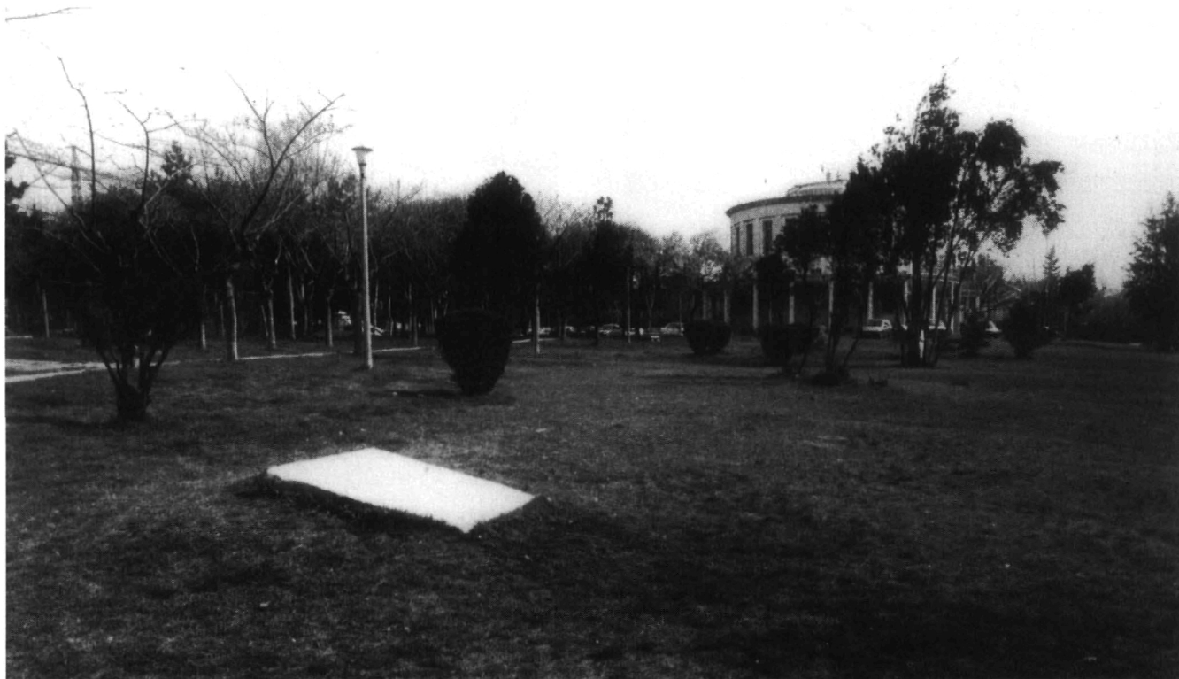
Έ. Τρακοσοπούλου, εικ. 1.: Πανεπιστημιούπολη Θεσσαλονίκης, Ύψαιθριος χώρος Μετεωροσκοπείου. Ένελίγραφο οίκοδομικό μέλος ταφικού κτίσματος. (S. 130).