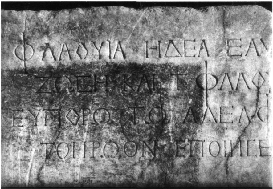
Έ. Τραχοσοπούλου, εικ. 3.: Έπιγραφή. (S. 132).