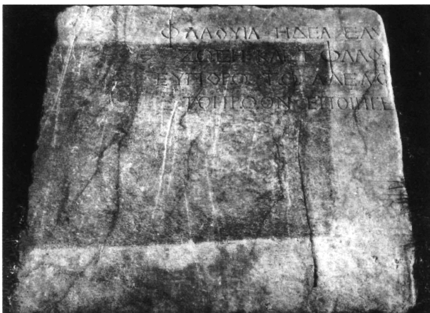
Ἐ. Τραχοσοπούλου, εἰκ. 2.: Ἐπιγραφή. (S. 132).