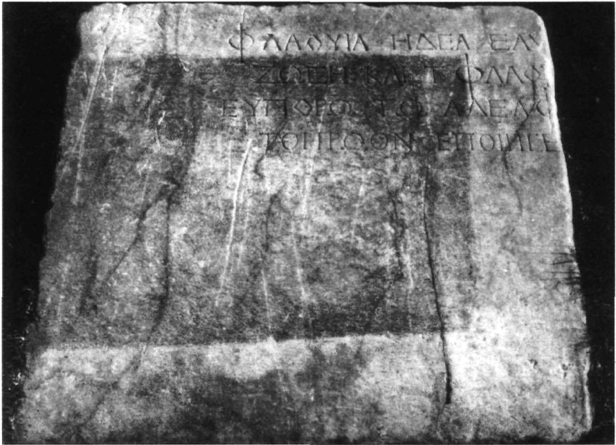
Έ. Τραχοσοπούλου, εικ. 2.: Έπιγραφή. (S. 132).