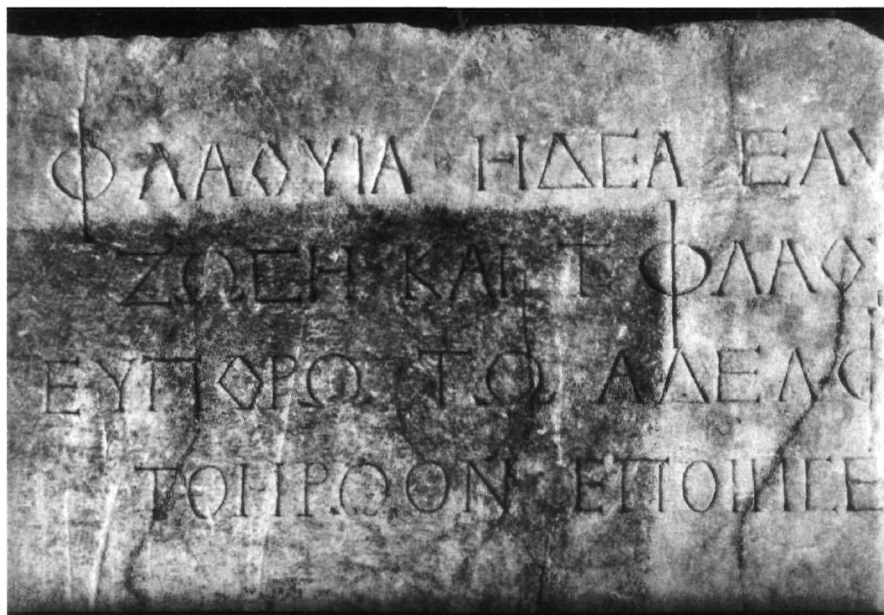
Ἐ. Τραχοσοπούλου, εἰκ. 3.: Ἐπιγραφή. (S. 132).