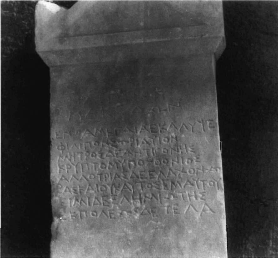
Π. Νίγδελης, εικ. 1.: Μακεδονικά Σύμμεικτα. (S. 173).