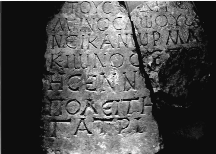
Π. Μ. Νίγδελης Ειχ. 3