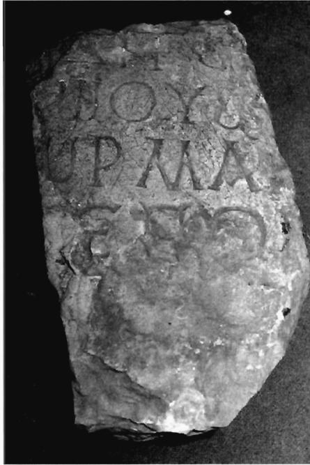
Π. Μ. Νίγδελης Ειχ. 2