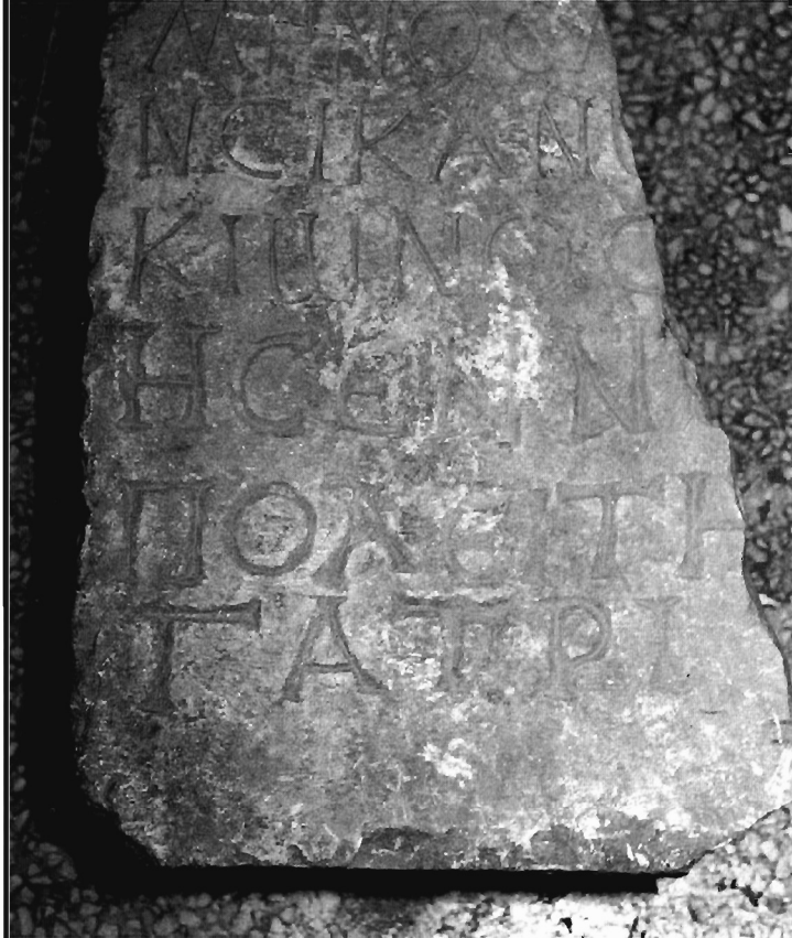
Π. Μ. Νύδελης Ειχ. 1