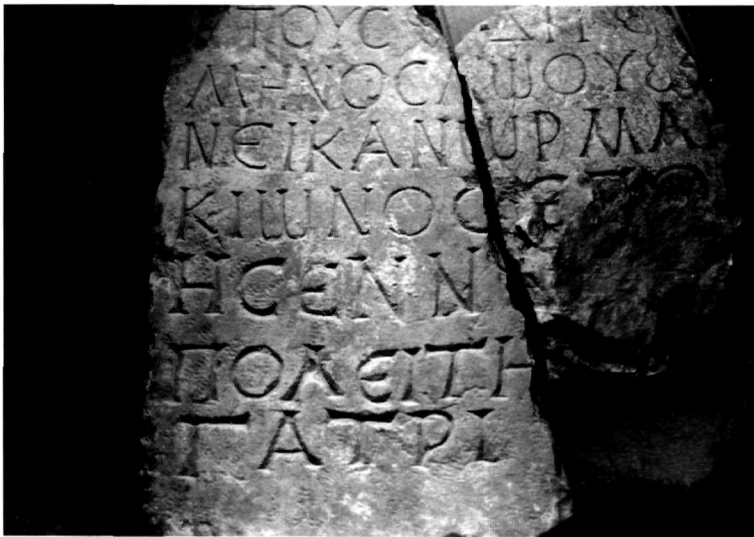
Π. Μ. Νίγδελης Ειχ. 3