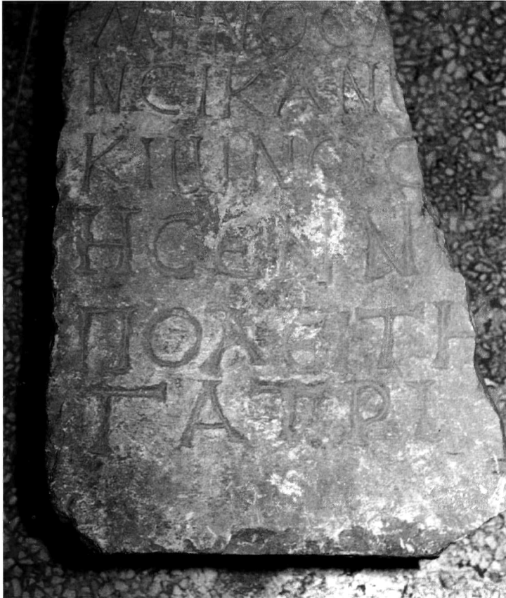
Π. Μ. Νίγδελης Ειχ. 1