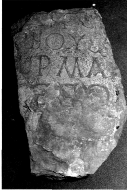
Π. Μ. Νίγδελης Ειχ. 2