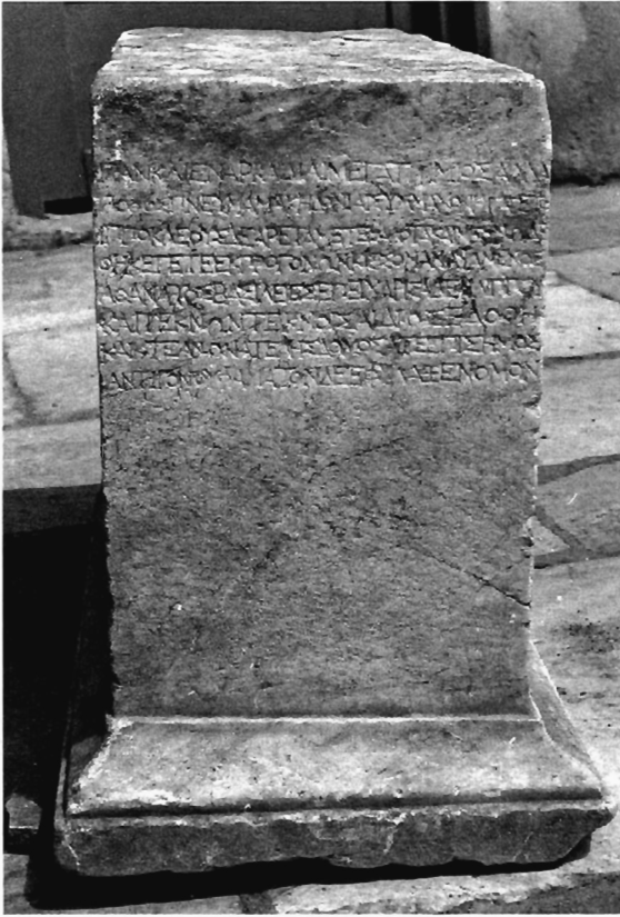
Θ. Παζαράς - Μ. Χατζόπουλος Εικ. 2. Τό βάθρο με την ἐνεπίγραφη ὄψη.