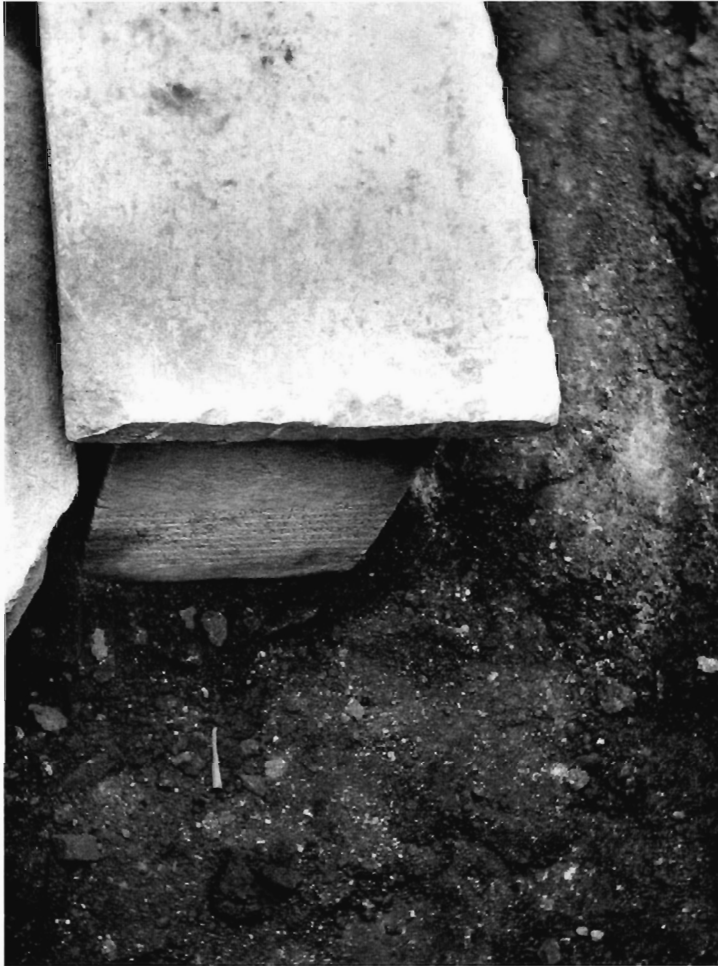
Θ. Παζαράς - Μ. Χατζόπουλος Εικ. 1. Τό πεσσόσχημο δάθρο κατά την άνεύρεσή του.