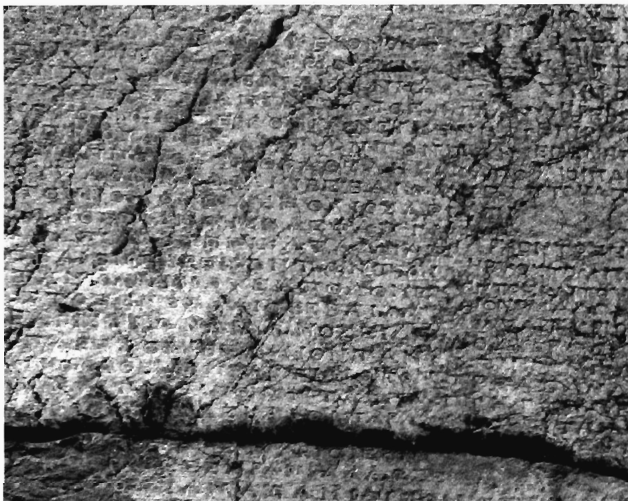
Ά. Κοντογιάννης Ειχ. 1.