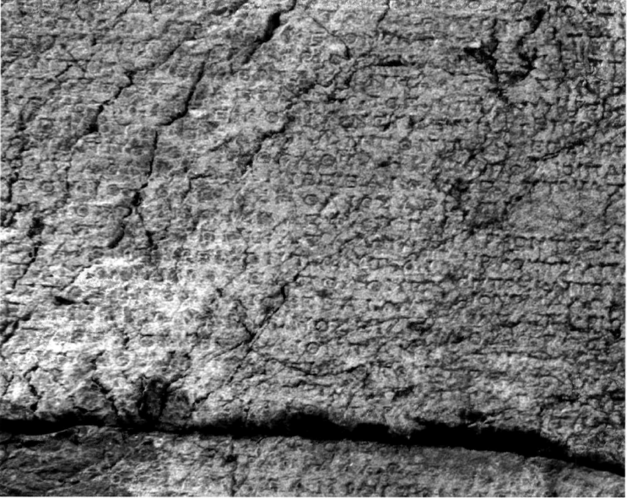
Ἄ. Κοντογιάννης Εἰξ. 1.