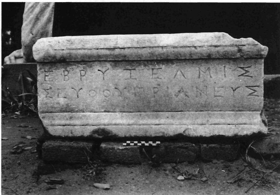
X. Βελγιάνη Ειχ. 1