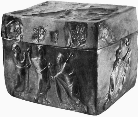
W. Binsfeld, Abb. 1: Reliquiar in Thessaloniki.