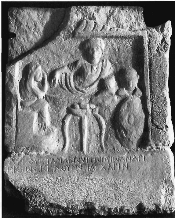
Π. Μ. Νίγδελης-Λ. Δ. Στεφανή, Εικ. 3