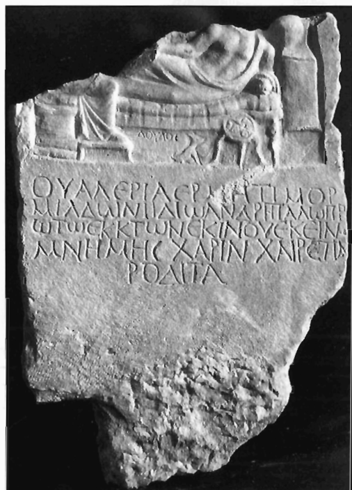
Π. Μ. Νίγδελης-Α. Δ. Στεφανή, Ειχ. 6