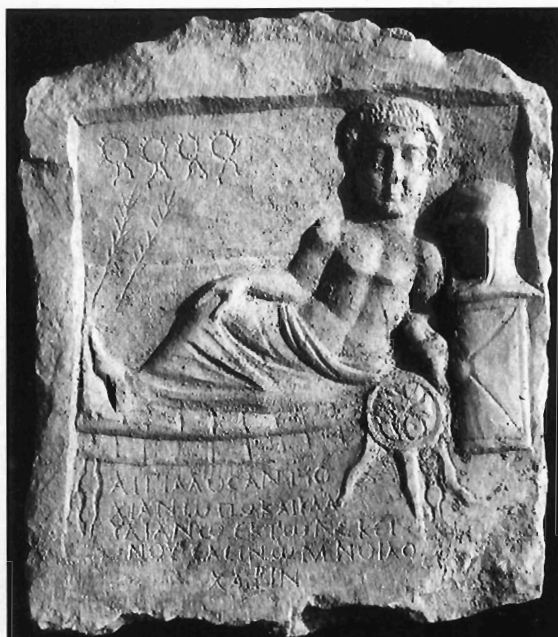
Π. Μ. Νίγδελης-Α. Δ. Στεφανή, Ειχ. 5