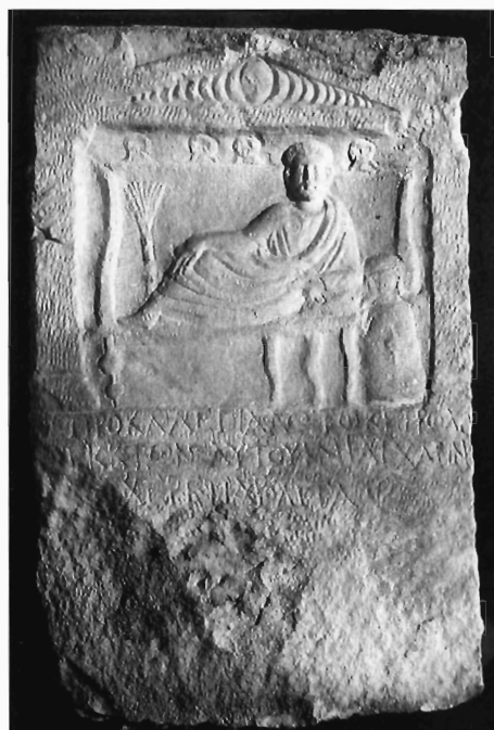
Π. Μ. Νίγδελης-Α. Δ. Στεφανή, Ειχ. 4