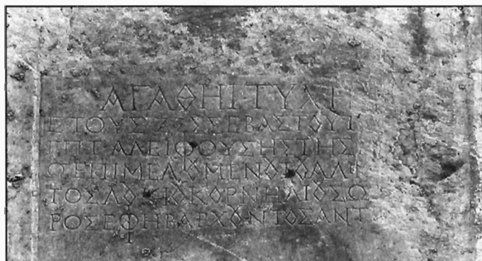
Π. Μ. Νίγδελης, Εικ. 1α