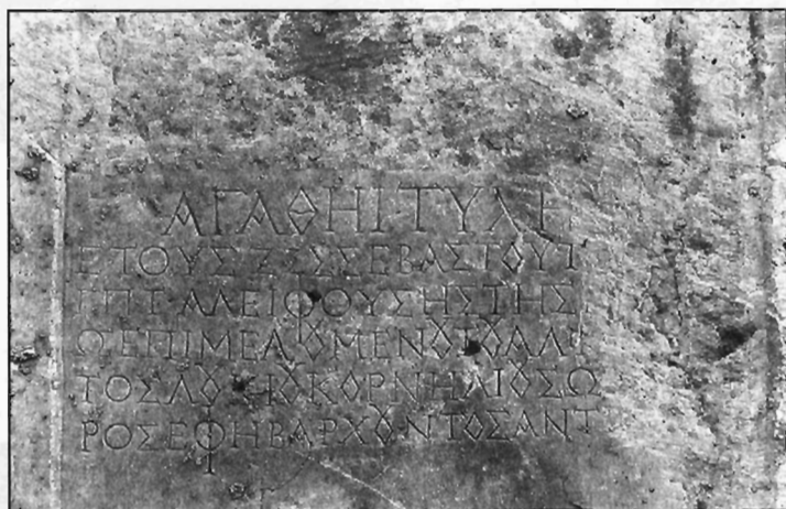
Π. Μ. Νίγδελης, Εικ. 16