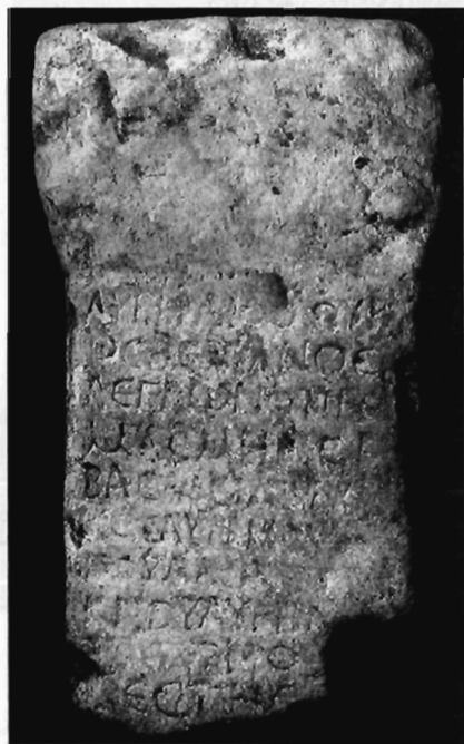
Π. Μ. Νίγδελης, Εικ. 2