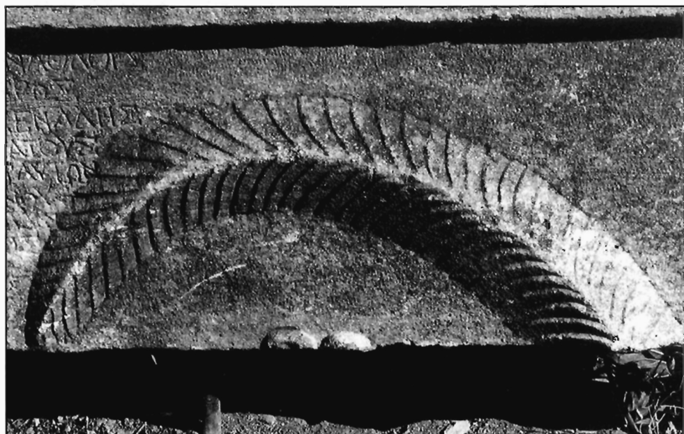
Π. Μ. Νύδελης, Είχ. 3δ