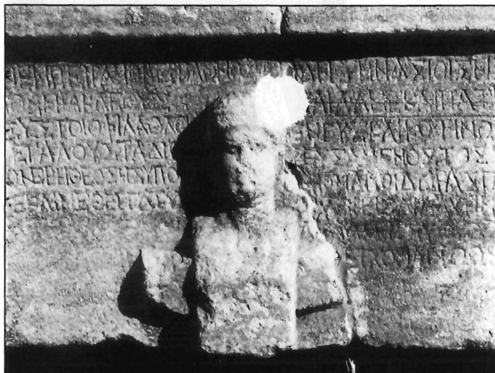
Π. Μ. Νίγδελης, Εικ. 3γ