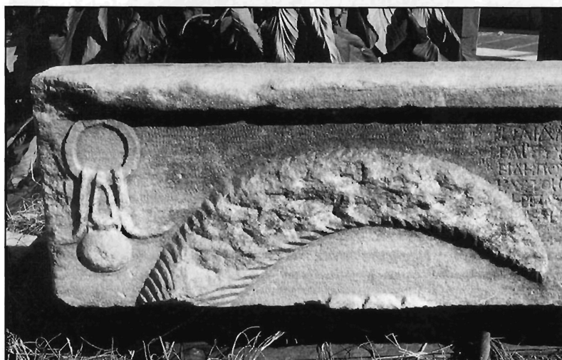
Π. Μ. Νίγδελης, Εικ. 3β