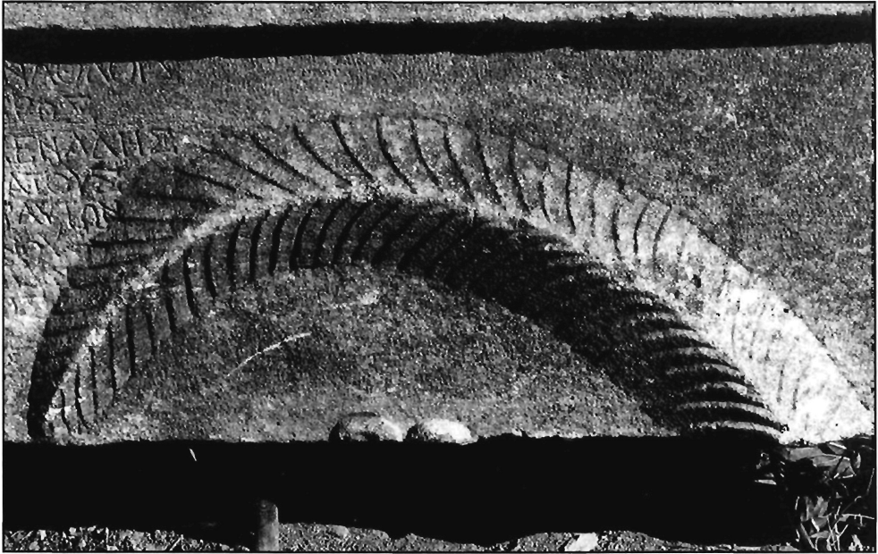
Π. Μ. Νίγδελης, Είχ. 3δ