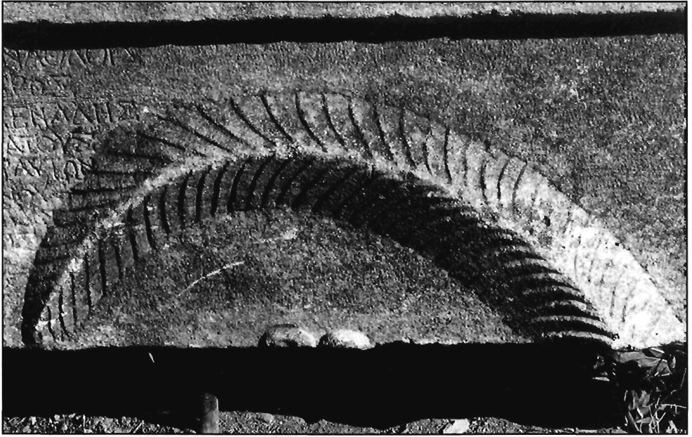
Π. Μ. Νίγδελης, Είχ. 3δ