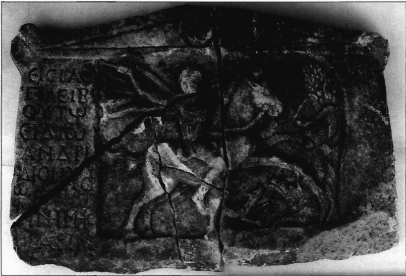
Μ. Βάλλα, Εικ. 1