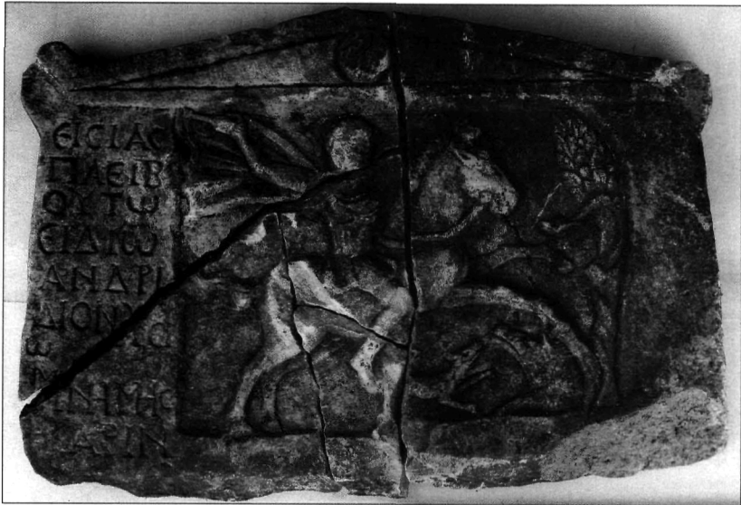
Μ. Βάλλα, Είχ. 1