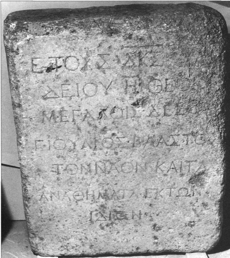
Χρ. Βελγιάνη, Είχ. 1