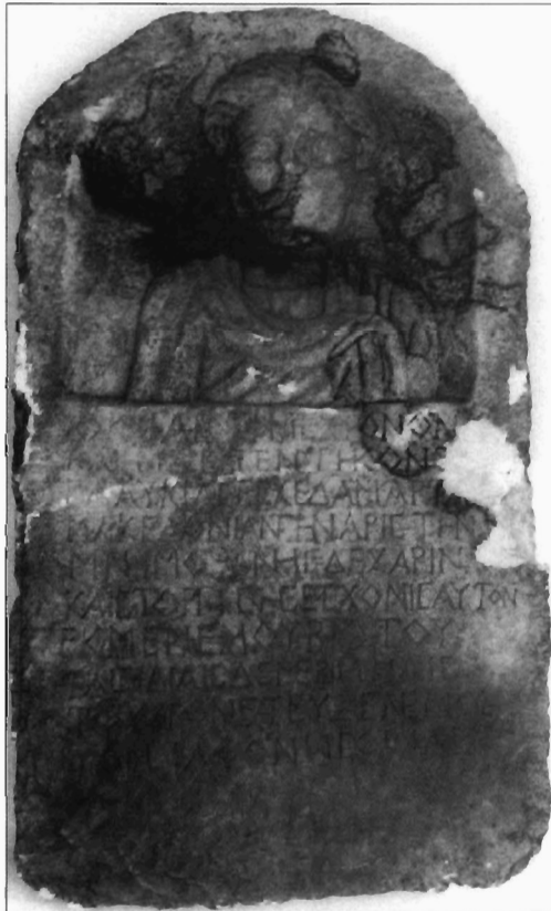
Ἡλ. Σβέροκος-Κ. Σισμανίδης, Εἰχ. 2