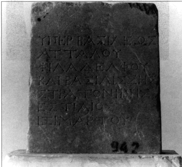
E. Sverkos, Abb. 3