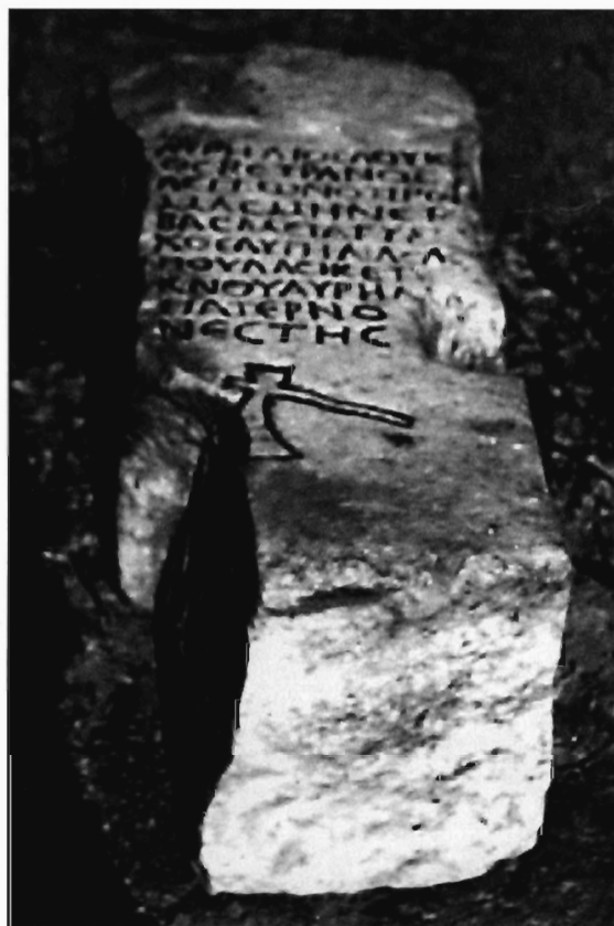
Π. Μ. Νίγδελης, Είχ. 1