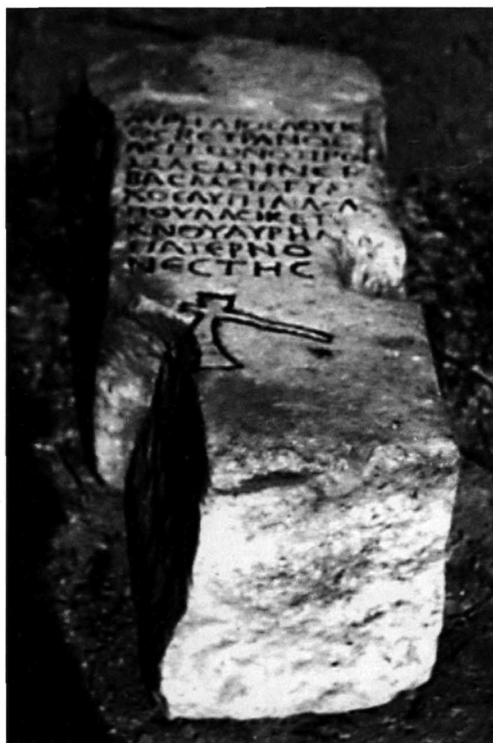
Π. Μ. Νίγδελης, Εικ. 1