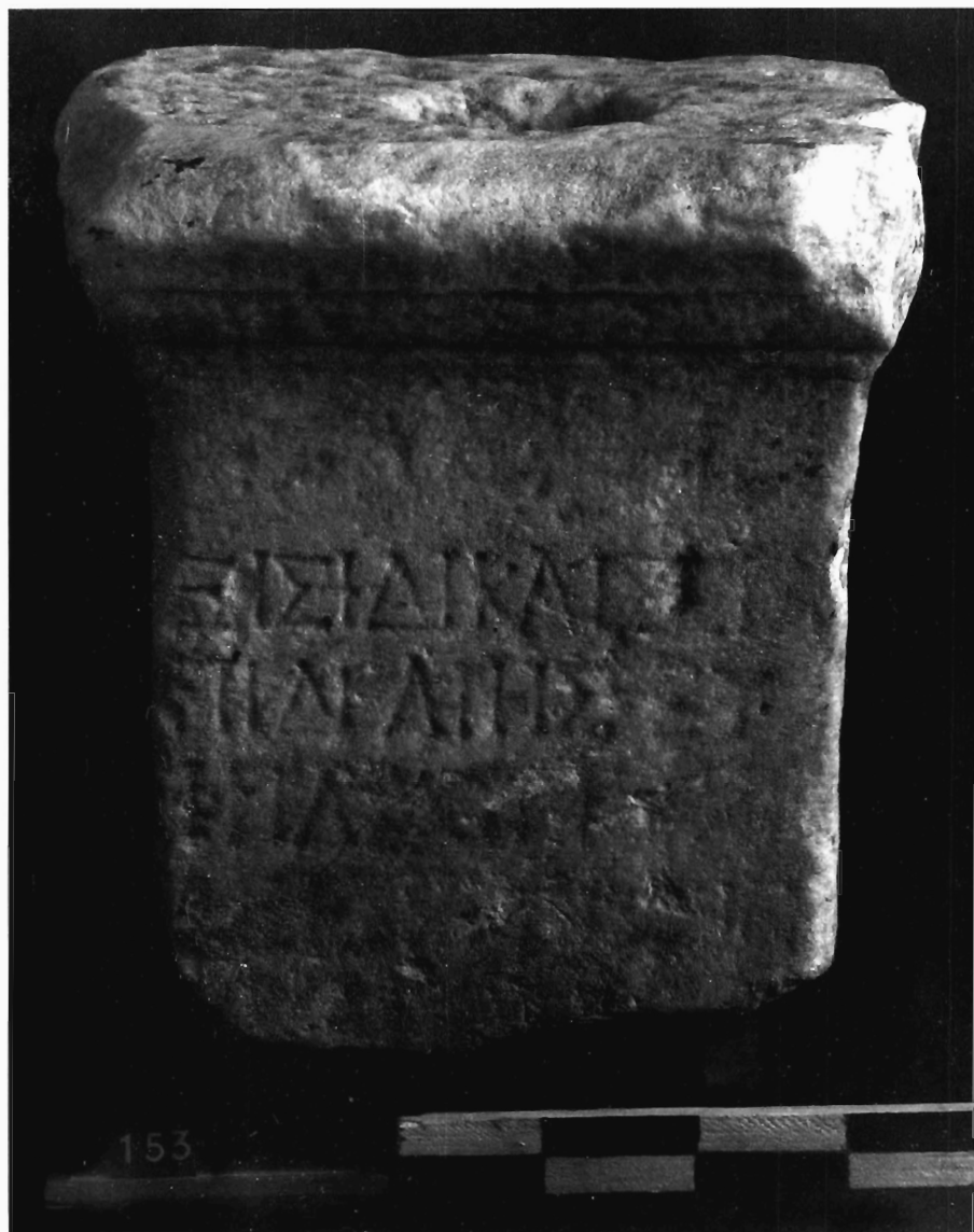
M.-G. Parissaki, Fig. 4