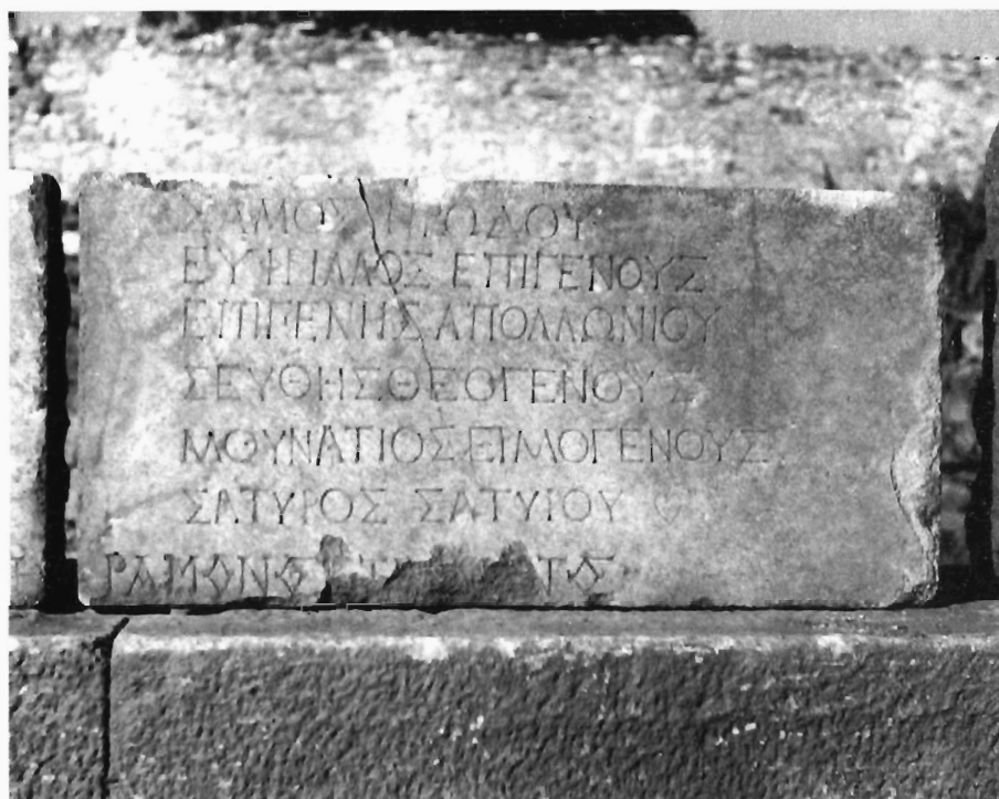
M.-G. Parissaki, Fig. 3