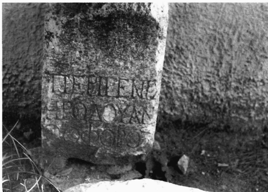
M.-G. Parissaki, Fig. 2