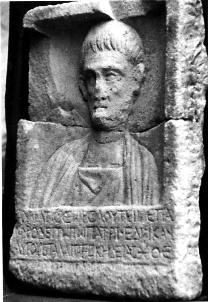
Ἦλ. Σβέγκος, Εἰκ. 1