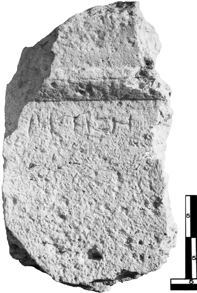
Εικ. 15. Η στήλη της Μησης.