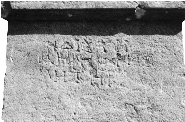
Εικ. 2. Η επιγραφή.