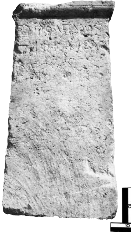
Εικ. 4. Η στήλη του Εὐπολέμου.