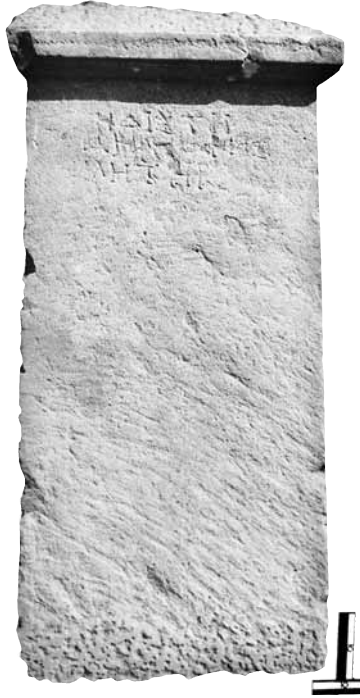
Εικ. 1. Η στήλη της Ἡδίστης.