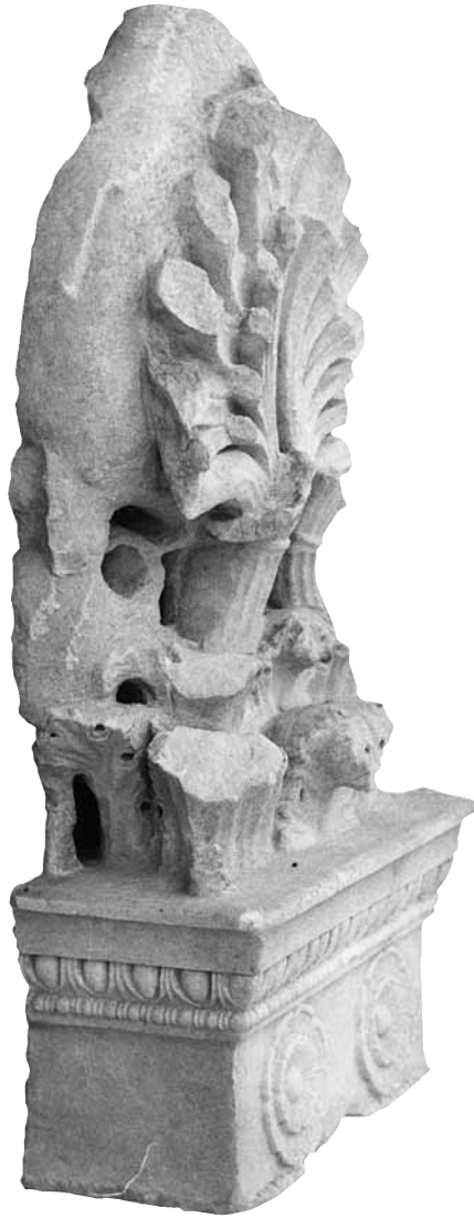
Εικ. 20. Η στύλη υπ' αρ. 16.