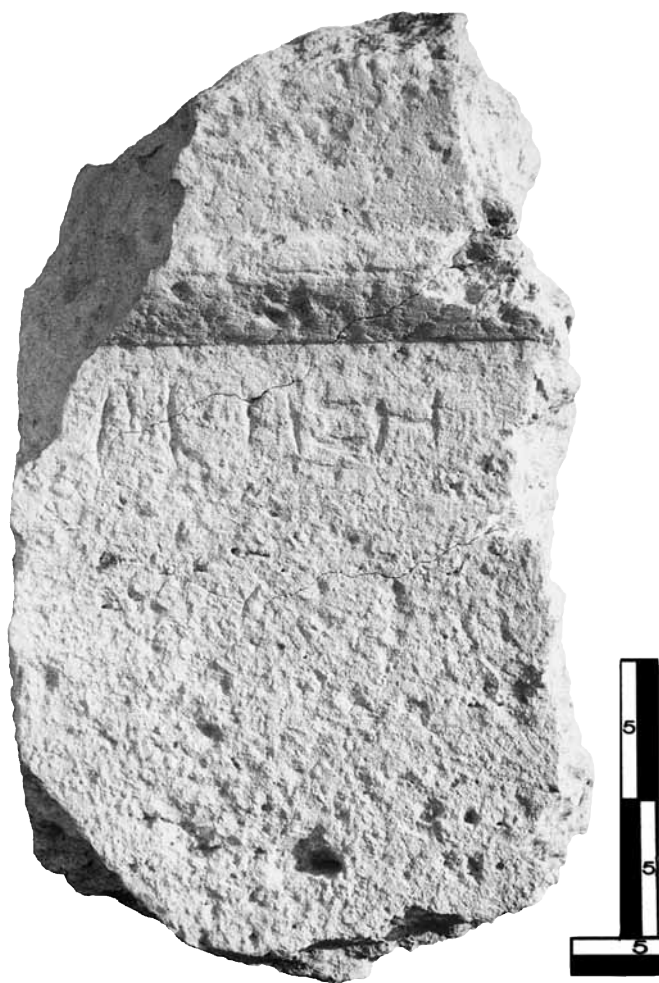
Εικ. 15. Η στήλη της Μησης.