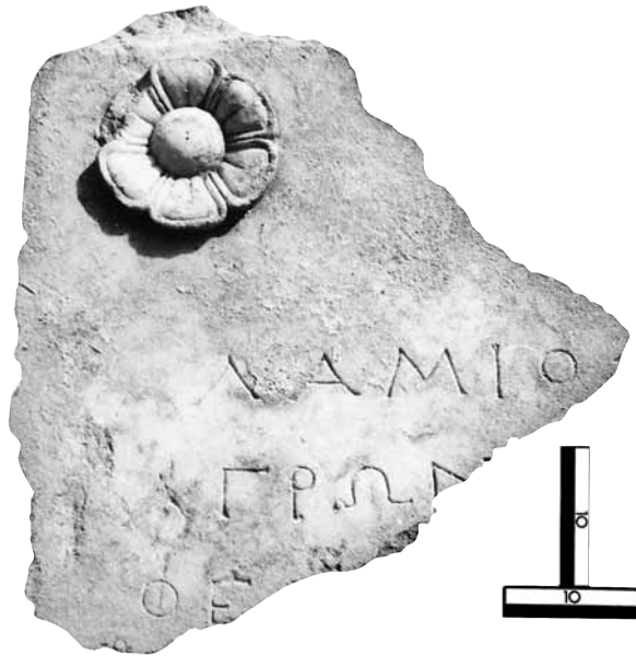
Εικ. 8. Η στήλη του Λαμίου.

μα τρίστιχης επιγραφής με γράμματα χαραγμένα με επιμέλεια, με διακριτούς αχρέμονες.