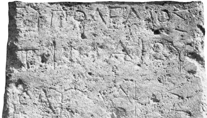
Εικ. 5. Η επιγραφή.