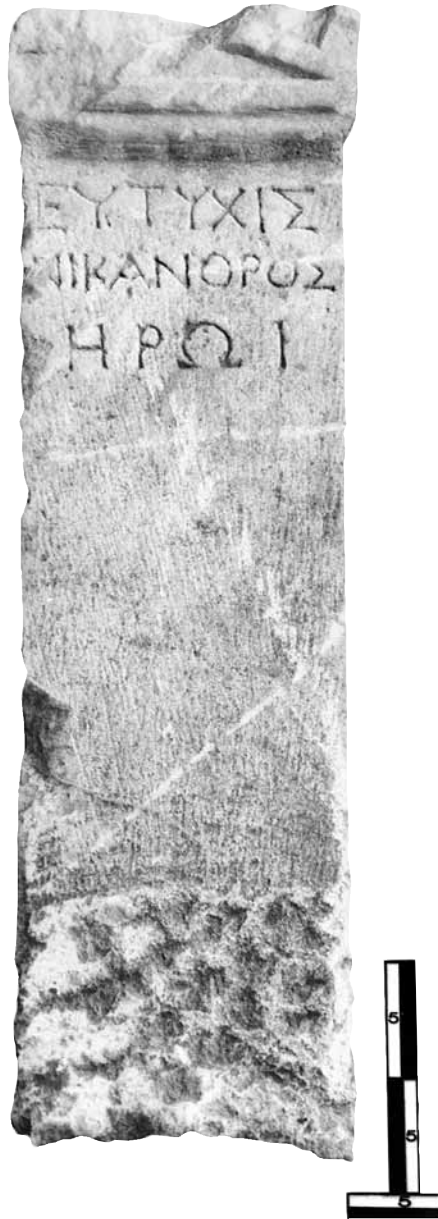
Εικ. 14. Η στήλη του Εύτυχί (ή της Εύτυχίδος).