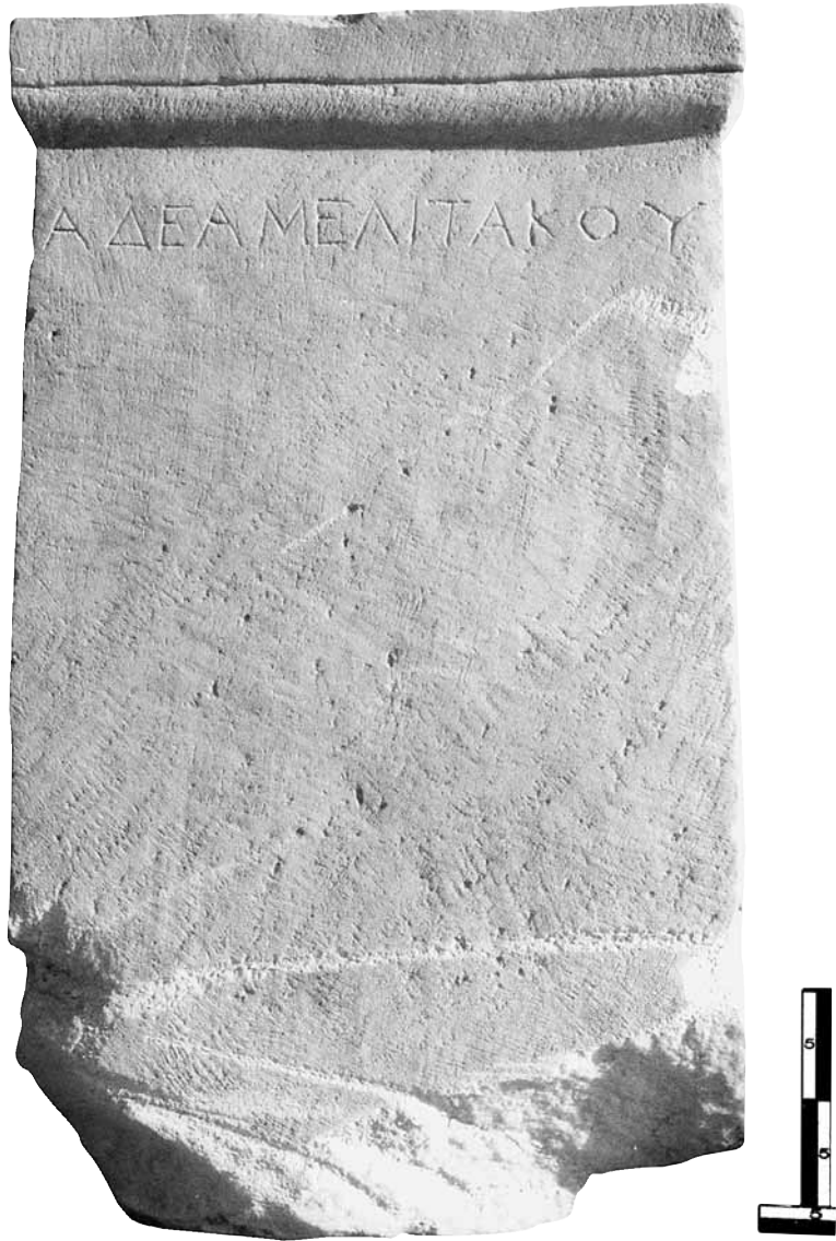
Εικ. 3. Η στήλη της 'Αδέας.