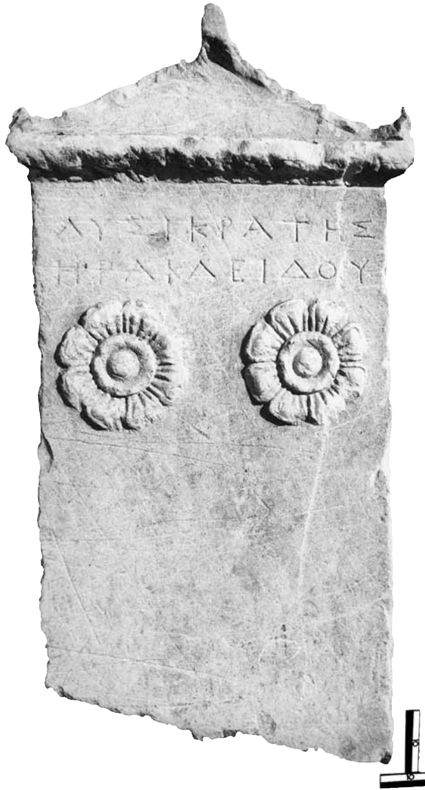
Εικ. 11. Η στήλη του Λυσικράτους.