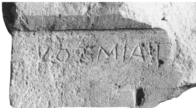
Εικ. 13. Η επιγραφή.