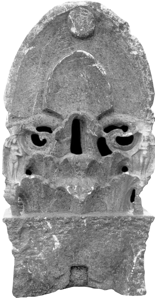
Ειχ. 21. Η στήλη υπ' αρ. 16 (πίσω όψη).