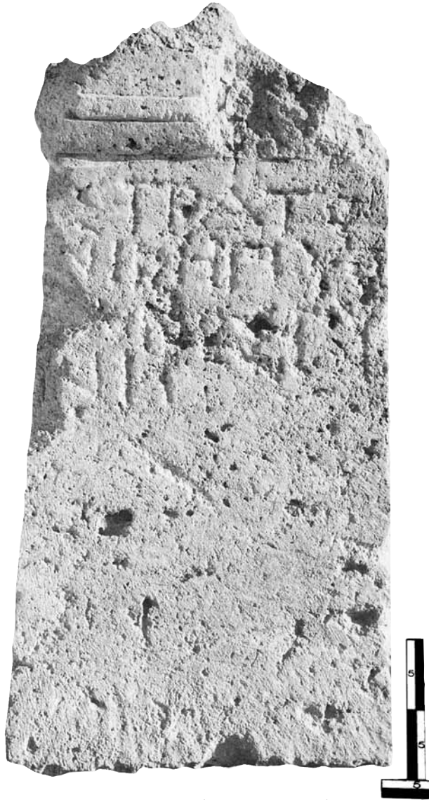
Εικ. 10. Η στήλη της Στρατονίχης.