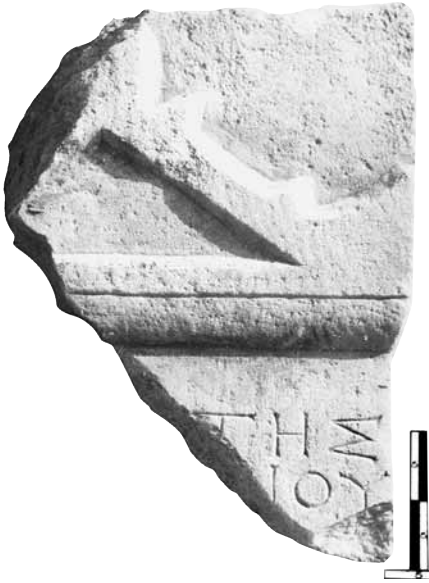
Εικ. 16. Η στήλη υπ' αρ. 13.

νία του οριζόντιου γείσου διαμορφώνεται κυρτό κυμάτιο, που συνεχίζεται και στις πλάγιες όψεις. Στο μπροστινό τμήμα της επάνω επιφάνειας, που είναι πολύ καλά δουλεμένη, υπάρχει ταινία με αδρότερη επεξεργασία με βελόνι.