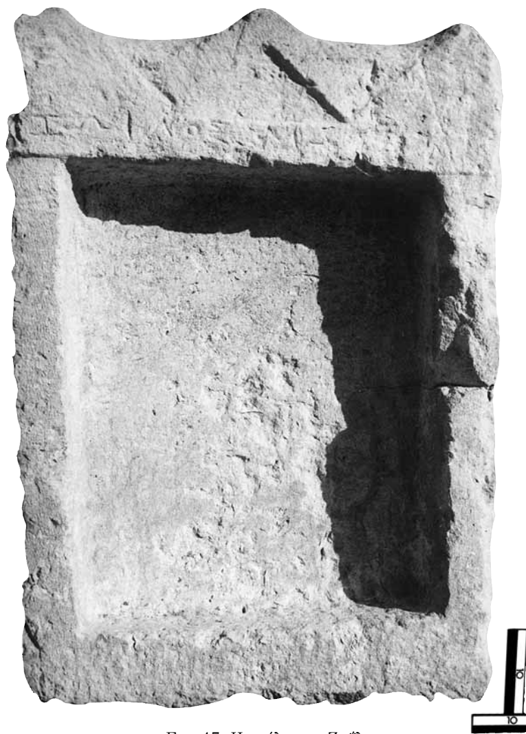
Εικ. 17. Η στήλη του Ζωΐλου.