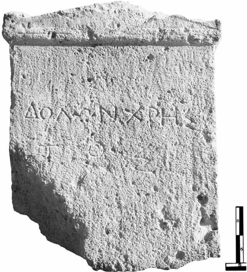
Εικ. 7. Η στήλη του Δόλωνος.