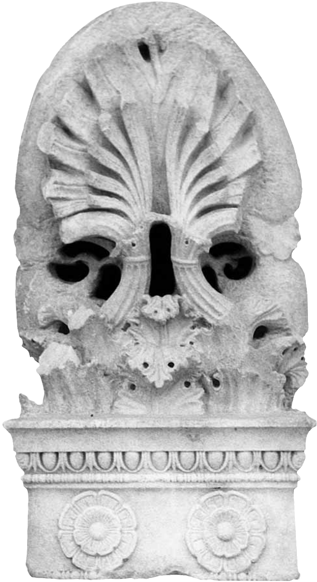
Εικ. 19. Η στήλη υπ' αρ. 16.