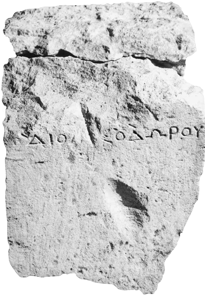
Εικ. 18. Η στήλη υπ' αρ. 15.