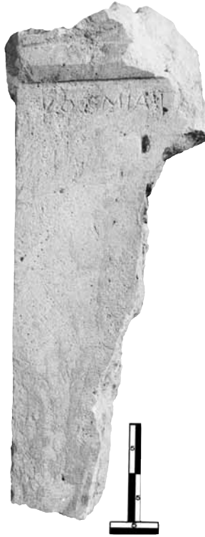
Εικ. 12. Η στήλη της Κοσμίας.