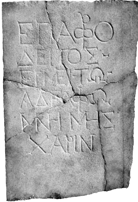
Εικ. 2α. Επιτύμβια επιγραφή του Έμοϋ, 2ος-3ος αι. μ.Χ.