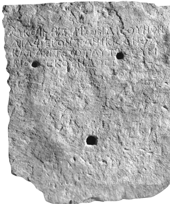
Εικ. 8. Επιτύμβια επιγραφή του Σεκούνδου , 4ος-5ος αι. μ.Χ.