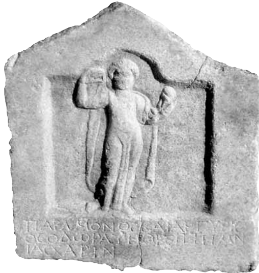
Εικ. 6. Επιτύμβια επιγραφή της Θεοδώρας, 2ος-3ος αι. μ.Χ.