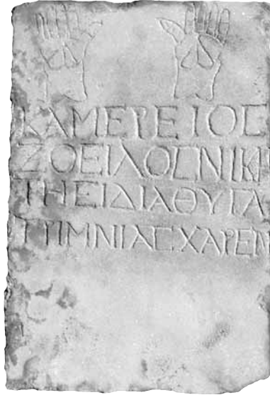
Εικ. 5. Επιτύμβια επιγραφή της Νί- κης, 2ος-3ος αι. μ.Χ.