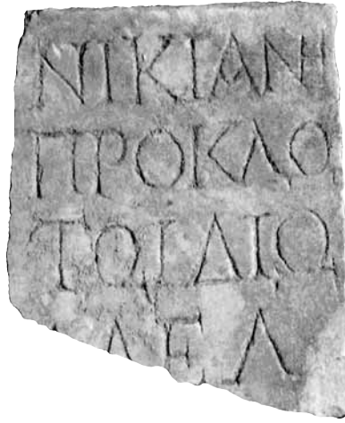
Εικ. 7. Επιτύμβια επιγραφή του Πρόκλου , 2ος-3ος αι. μ.Χ.