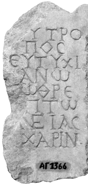
Εικ. 4. Επιτύμβια επιγραφή του Εὐτυχιανού, 2ος-3ος αι. μ.Χ.