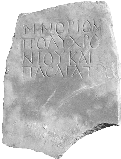
Εικ. 10. Επιτύμβια επιγραφή του Πολυχρονίου και της Πασαγάτης , 5ος-6ος αι. μ.Χ.