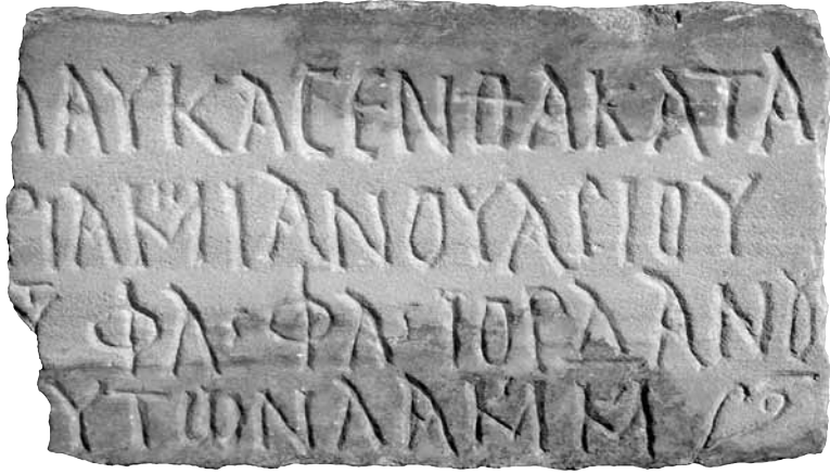
Εικ. 9. Επιτύμβια επιγραφή της Μαρίας (;), 470 μ.Χ.