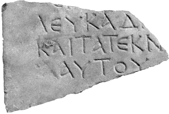
Εικ. 3. Επιτύμβια επιγραφή του γιού του Λευκαδίου, 2ος-3ος αι. μ.Χ.