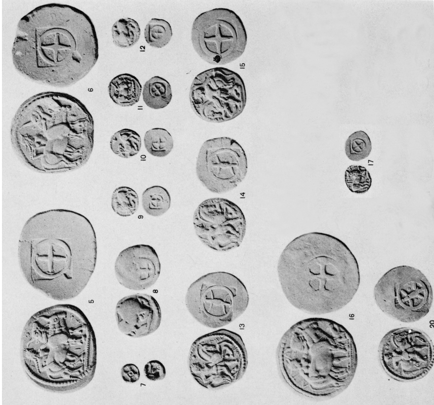
J.N. Svoronos, planche IV.