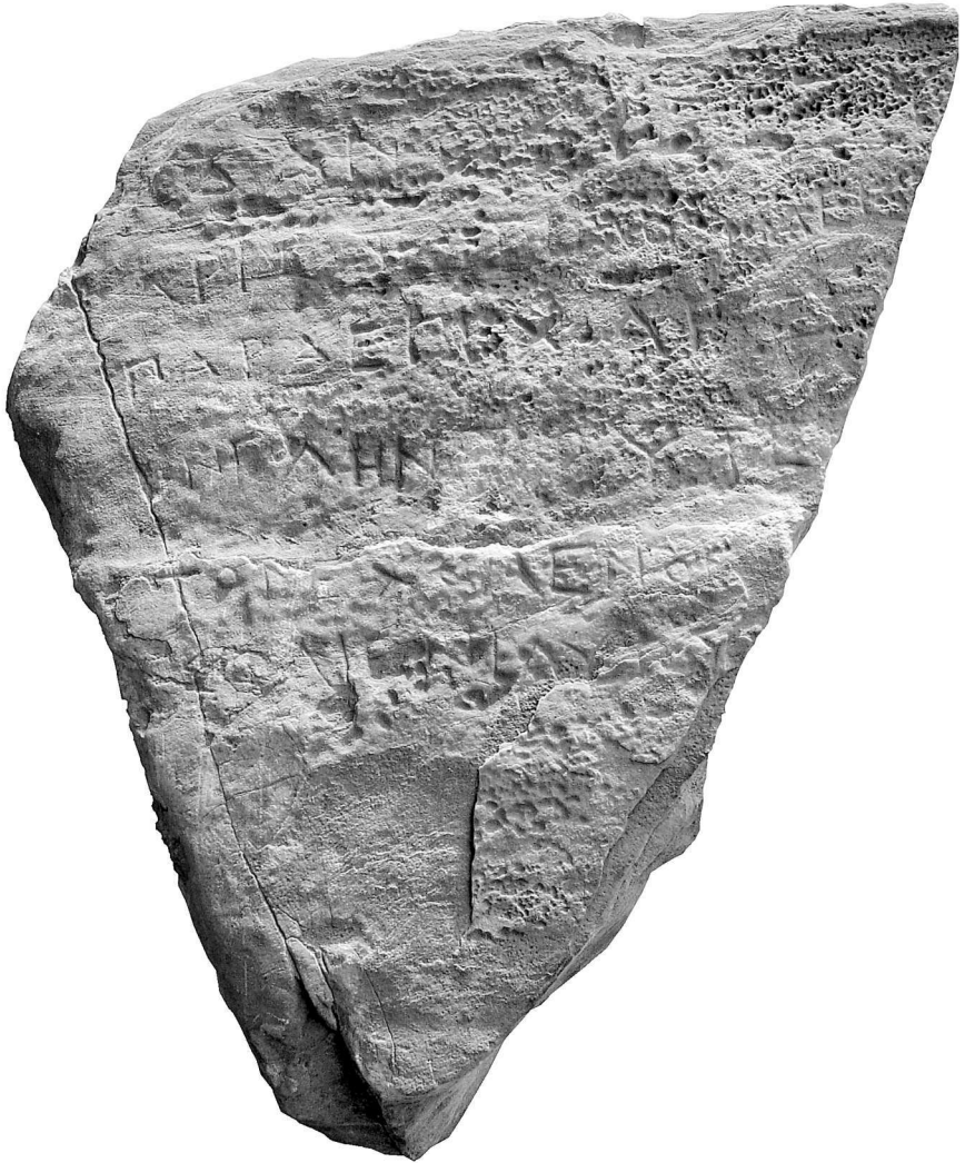
Εικ. 1. Η επιγραφή