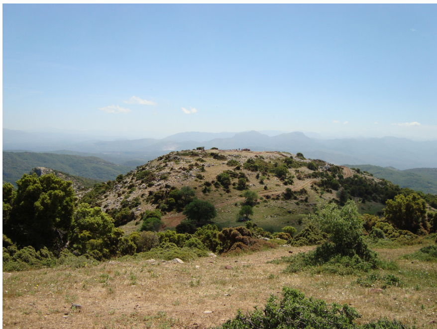
Εικόνα 3: Το ύψωμα «Πετρούλα/ Πισαηλιάς» στην Άνω Μέλπεια Μεσσηνίας, όπου ανασκάφηκε ο δωρικός ναός. Στο βάθος διακρίνεται το όρος Ιθώμη (Φωτογραφία Σ.Σ. Κουρσούμης. Λήψη από ΒΑ)