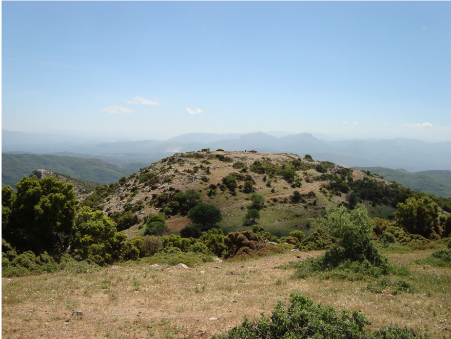
Εικόνα 3: Το ύψωμα «Πετρούλα/ Πισαηλιάς» στην Άνω Μέλπεια Μεσσηνίας, όπου ανασκάφηκε ο δωρικός ναός. Στο βάθος διακρίνεται το όρος Ιθώμη (Λήψη από ΒΑ)