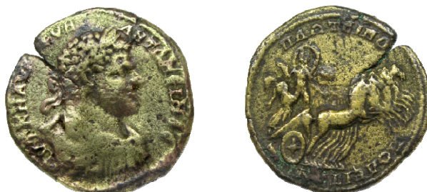
Εικ. 1.1. Πλωτινόπολις, ἐπὶ Καρακάλλα (διάμ. 35 χιλ., βάρ. 17.16 γρ., ἄξονας 12h)