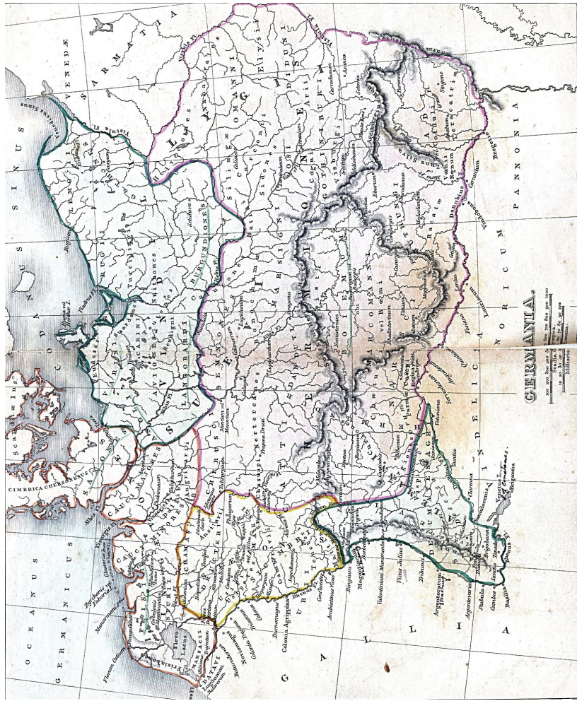
1) Χάρτης που απεικονίζει τη Magna Germania κατά τον πρώιμο 2ο μ.Χ. αιώνα, σύμφωνα με την περιγραφή του Τάκτου. Στα βορειοανατολικά της όρια διακρίνονται οι Venethi/Ουενέδοι.