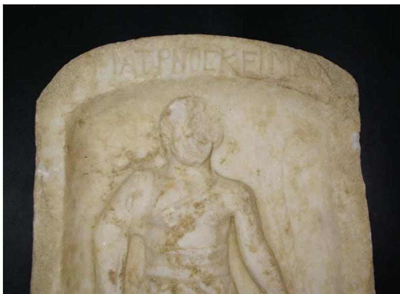
Εικόνα 4. Επιτύμβια στήλη μονομάχου (λεπτομέρεια)