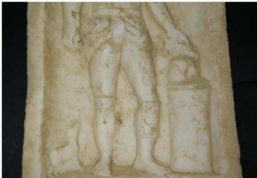
Εικόνα 5. Επιτύμβια στήλη μονομάχου (λεπτομέρεια)