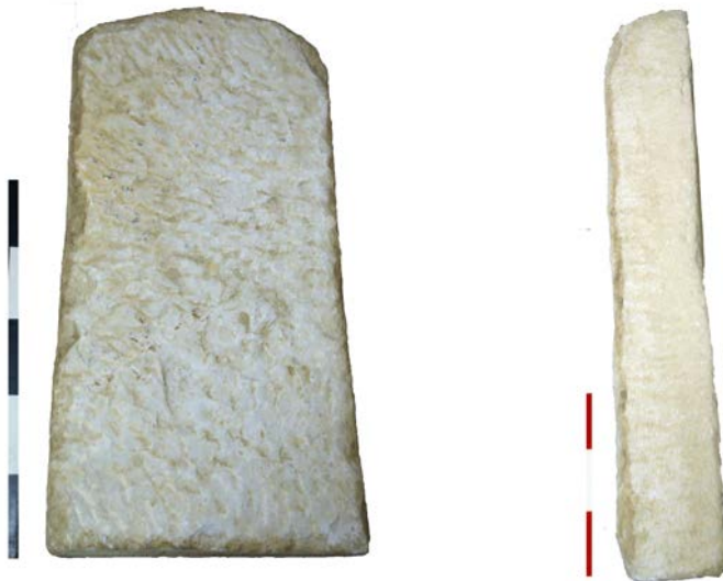
Εικόνα 3α. Η πίσω πλευρά του μνημείου Εικόνα 3β. Η πλάγια όψη του μνημείου