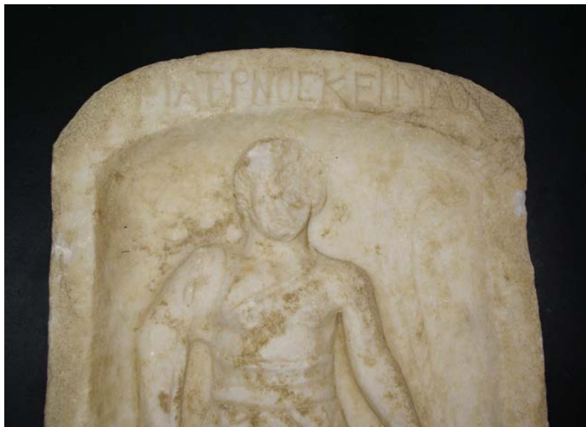
Εικόνα 4. Επιτύμβια στήλη μονομάχου (λεπτομέρεια)