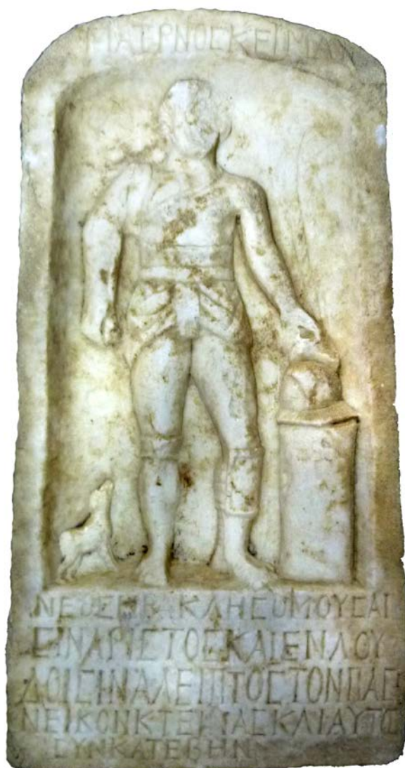
Εικόνα 2. Επιτύμβια στήλη μονομάχου (τέλη 2ου – αρχές 3ου αι. μ.Χ.)