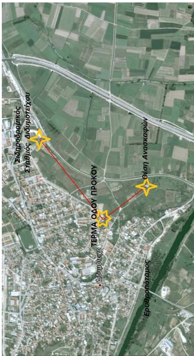
Εικόνα 1. Διδυμότειχο. Απόσπασμα ορθοφωτοχάρτη