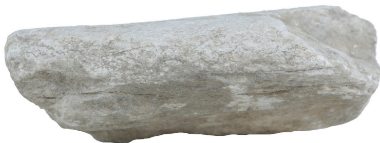
Εικ. 9. Η άνω επιφάνεια της ανεπίγραφης στήλης.