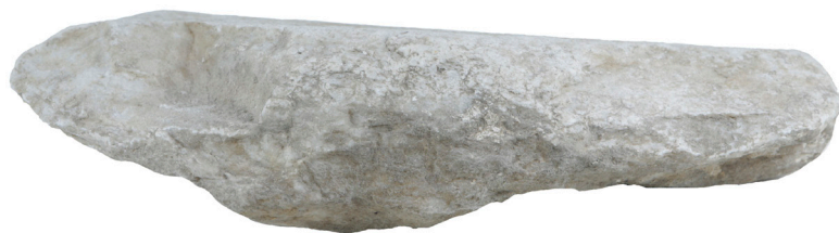
Εικ. 8. Η αριστερή πλαϊνή όψη της ανεπίγραφης στήλης.