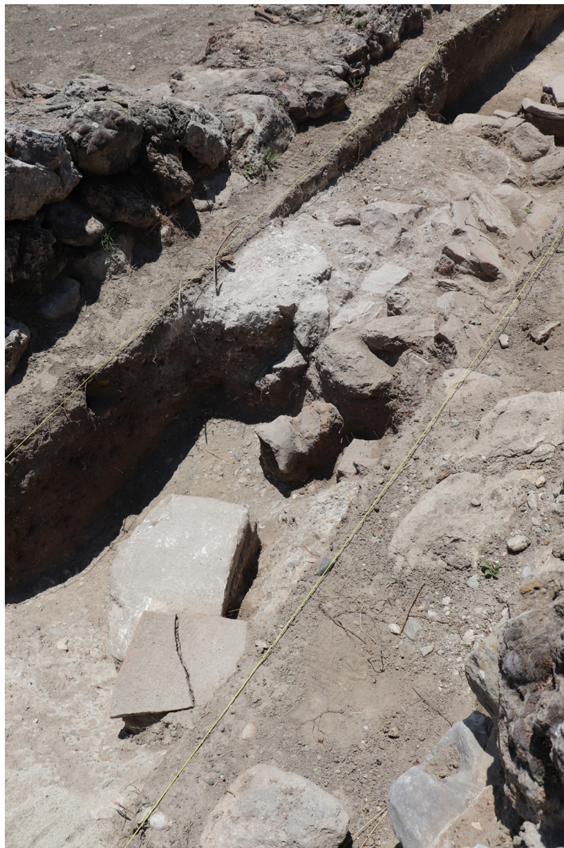
Εικ. 4. Η θέση εύρεσης της ανεπίγραφης στήλης.