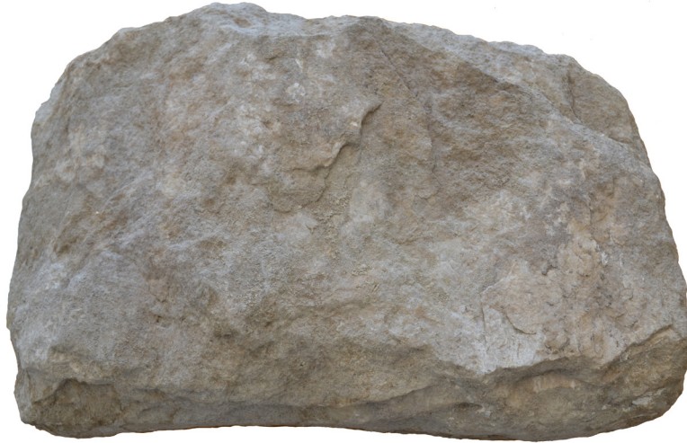
Εικ. 6. Η οπίσθια όψη της ενεπίγραφης στήλης.