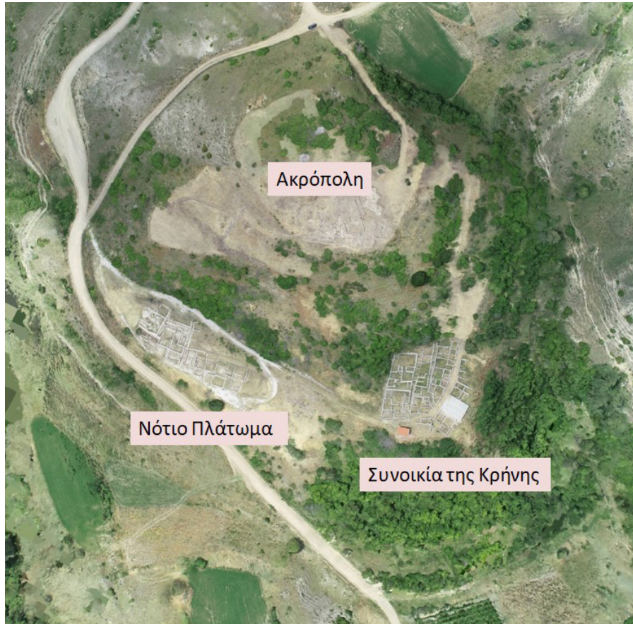
Εικ. 2. Αεροφωτογραφία με τους τρεις τομείς των ανασκαφών.