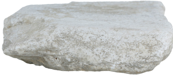
Εικ. 10. Η κάτω επιφάνεια της ενεπίγραφης στήλης.