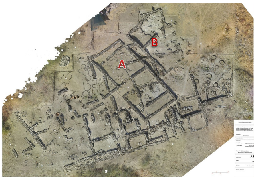
Εικ. 3. Αεροφωτογραφία της ακρόπολης με τα κτίρια A και B.