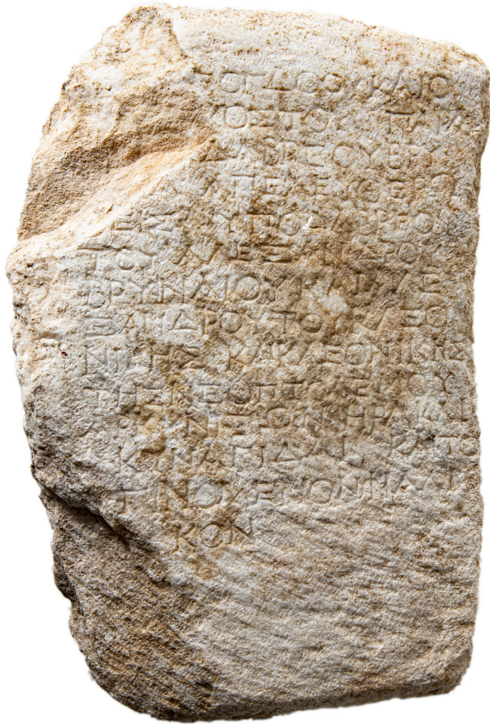
Εικ. 5. Η κύρια όψη της ενεπίγραφης στήλης.