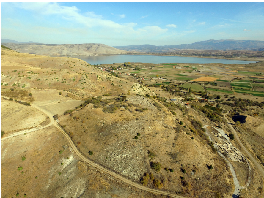
Εικ. 1. Γενική θέση του οικισμού των Πετρών.