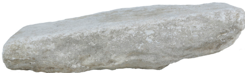
Εικ. 7. Η δεξιά πλαϊνή όψη της ενεπίγραφης στήλης.