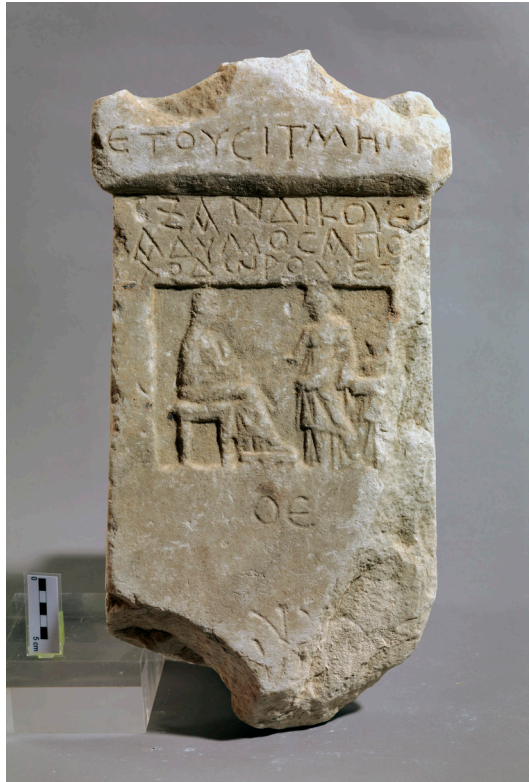
Fig. 3. Stèle funéraire d'Hadymos.