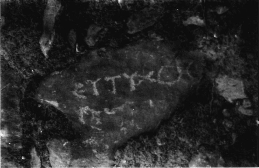
A. Chaniotis, Taf. I. (S. 15).