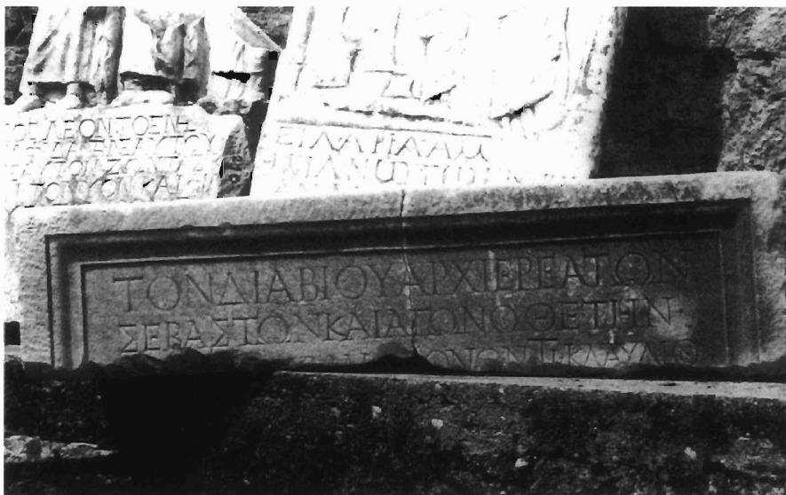
Π. Νίγδελης, εικ. 2.: Μακεδονικά Σύμμεικτα. (S. 181).