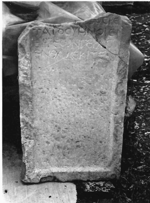
Α. Κουκουβού Ειχ. 2