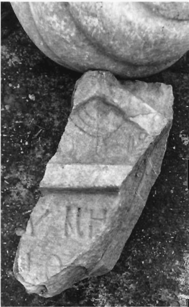
Α. Κουζουβού Ειχ. 4