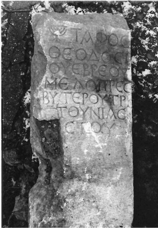
Α. Κουκουβού Ειχ. 1