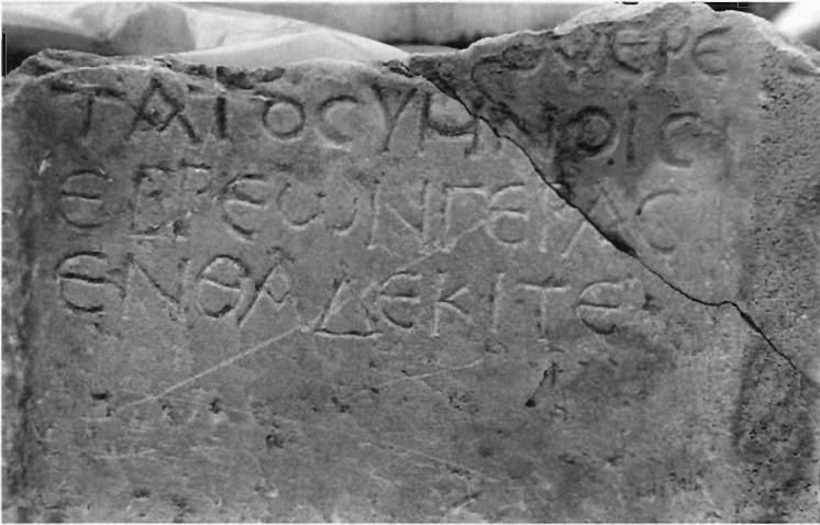
Α. Κουζουβού Ειχ. 3