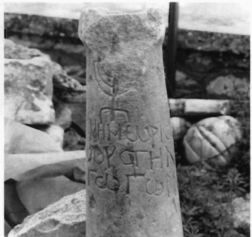
Α. Κουζουβού Ειχ. 5