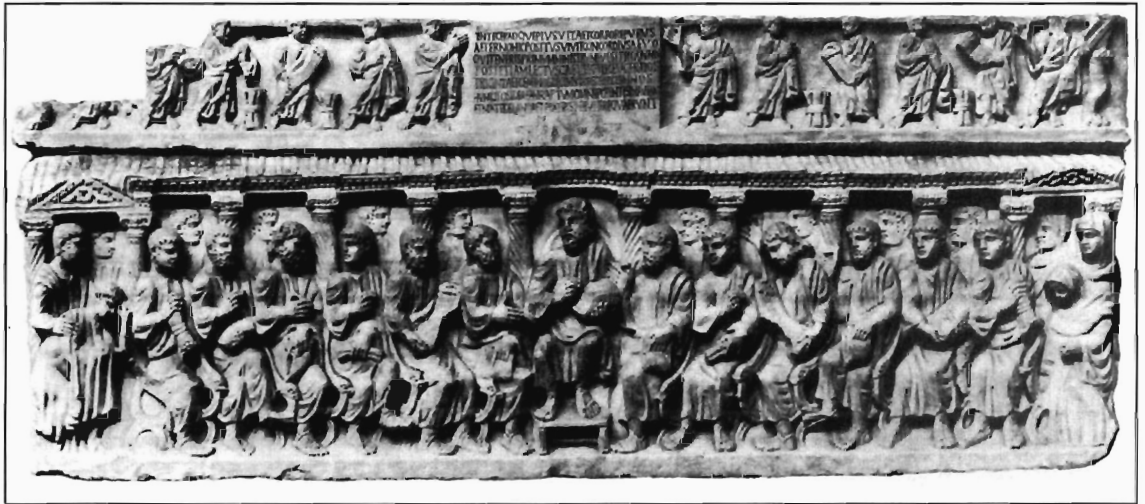
W. Binsfeld, Abb. 2: Sarkophag in Arles, nach Le Bland 1878