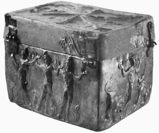
W. Binsfeld, Abb. 1: Reliquiar in Thessaloniki.