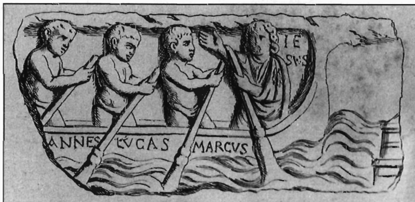
W. Binsfeld, Abb. 5: Sarkophagdeckel in Vatikan, nach Garrucci 1879