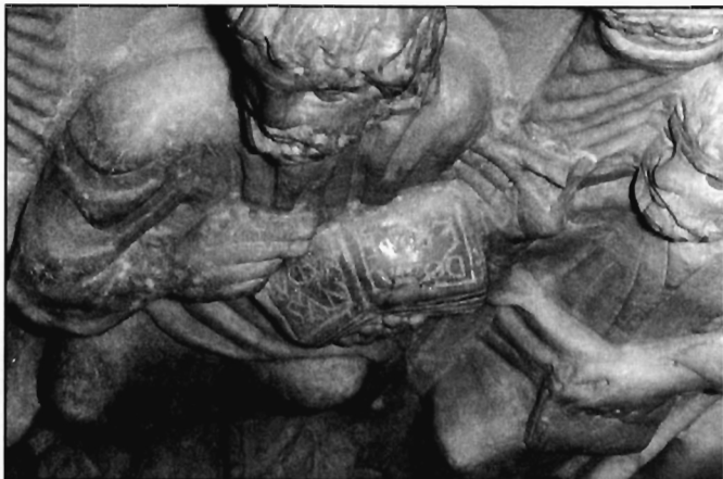
W. Binsfeld, Abb. 3: Sarkophag in Arles, Inschrift auf Christi Codex