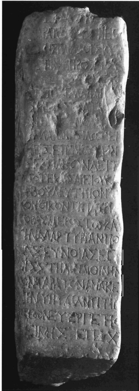
Π. Μ. Νιγδελής, Είχ. 1α