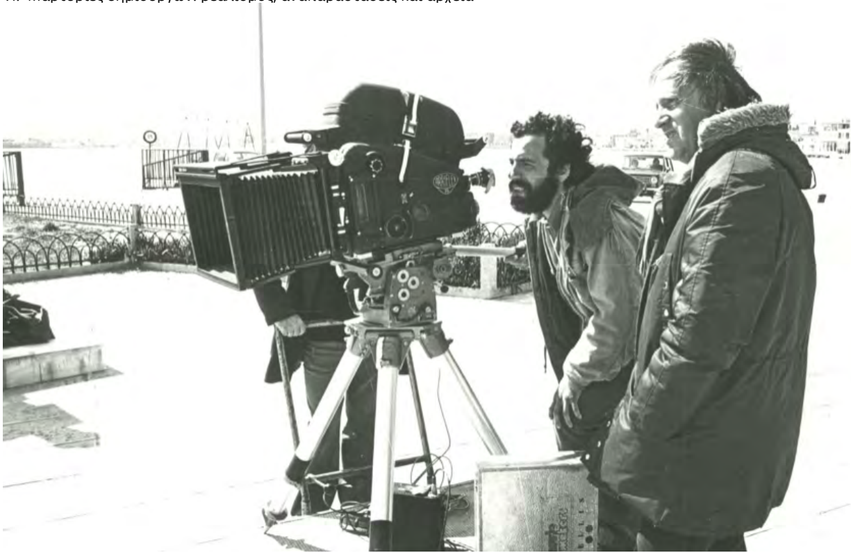
Εικόνα 2. «Χρυσομαλλούσα», Ζάκυνθος, 1978

ος, ζακυνθινής καταγωγής. Η ατμόσφαιρα των νησιών γύρω μου, είτε την ζω είτε την επεξεργάζομαι σεναριακά, όπως και το παρελθόν των ηρώων που με απασχολούν, συνθέτουν πάντα τις εικόνες και τους ήχους που με περιβάλλουν και με καθοδηγούν δραματουργικά και αισθητικά. Κι αυτό ισχύει από την πρώτη μου κιόλας ταινία, τη ζακυνθινή Χρυσομαλλούσα 1 του 1978, έως και τα τρέχοντα κινηματογραφικά μου σχέδια. Ιδιαίτερα στην πρώτη εκείνη κινηματογραφική μου πρόταση, οι μοναδικές πολιτιστικές δράσεις των θεατρικών «Ομιλιών» του νησιού μου αποτέλεσαν ένα κυρίαρχο άλλοθι για την κατάθεση του ιστορικού και κοινωνικού ρόλου του Λαϊκού Θεάτρου, σε όλους τους προηγούμενους αιώνες έως και σήμερα, μέσα από τη σωστική αποτύπωση και δραματουργική διαχείριση του κινηματογραφικού μέσου.