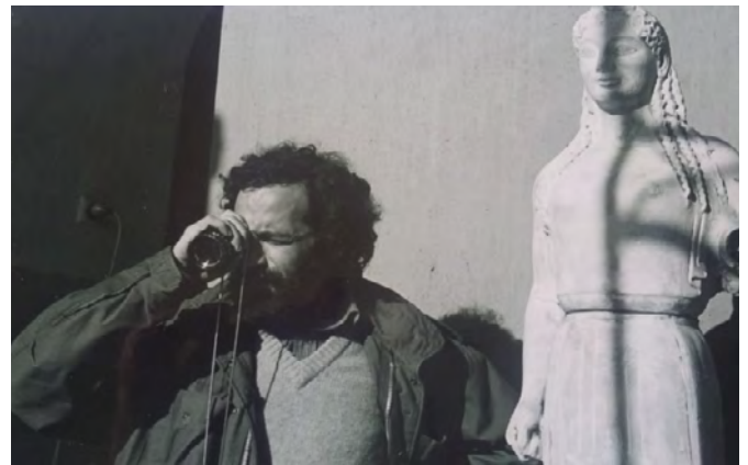
Εικόνα 4. «Το αίμα των αγαλμάτων», Ελευσίνα, 1982

Και αυτός ο εκ νέου διάλογος με την εντοπιότητα της Μνήμης αποτελεί για εμένα, τον ζακυνθινό κινηματογραφιστή, τη διαρκή πηγή της δημιουργικής μου αναζήτησης. Οι κύκλοι της Ιστορίας και του Πολιτισμού παράγουν στοιχεία αναφοράς που εντάσσονται στην ανάπτυξη της οπτικοακουστικής αφήγησης, χωρίς να υπογραμμίζουν εξ αρχής την προέλευση τους, αλλά αντίθετα συνθέτοντας στα μάτια των θεατών το ευρύ πλαίσιο ενός φανταστικού Σήμερα μέσα από τα θραύσματα ενός πραγματικού Χθες.