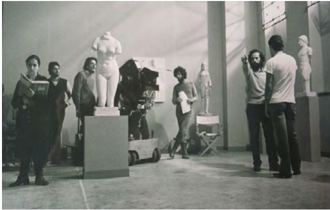
Εικόνα 3. «Το αίμα των αγαλμάτων», Ελευσίνα, 1982

όπως η προαιώνια νησιωτική Μονή των Στροφάδων, αλλά και οι υπόγειες διαμάχες και εν συνεχεία ακραίες συγκρούσεις, είτε μέσα από την επίδραση της λαϊκής θεατρικής παράστασης «Η Χρυσομαλλούσα» στον μικρόκοσμο του ορεινού ζακυνθινού χωριού, είτε μέσα από τις επάλληλες ανακατατάξεις και ανατροπές της αρχοντικής Κερκυραϊκής οικογένειας των Οφιομάχων, κάτω από την λαίλαπα των οικονομικών άρα ταξικών αλλαγών σε έναν κόσμο που για πολλά χρόνια έδειχνε ιστορικά αναλλοίωτος.