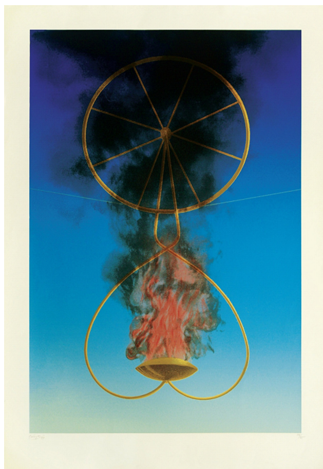
Μετέωρος βωμός Μακέτα για το σκηνικό του Θόδωρου, στο Θέατρο Επιδαύρου για την τραγωδία του Ευριπίδη Φοίνισσες , 1983.