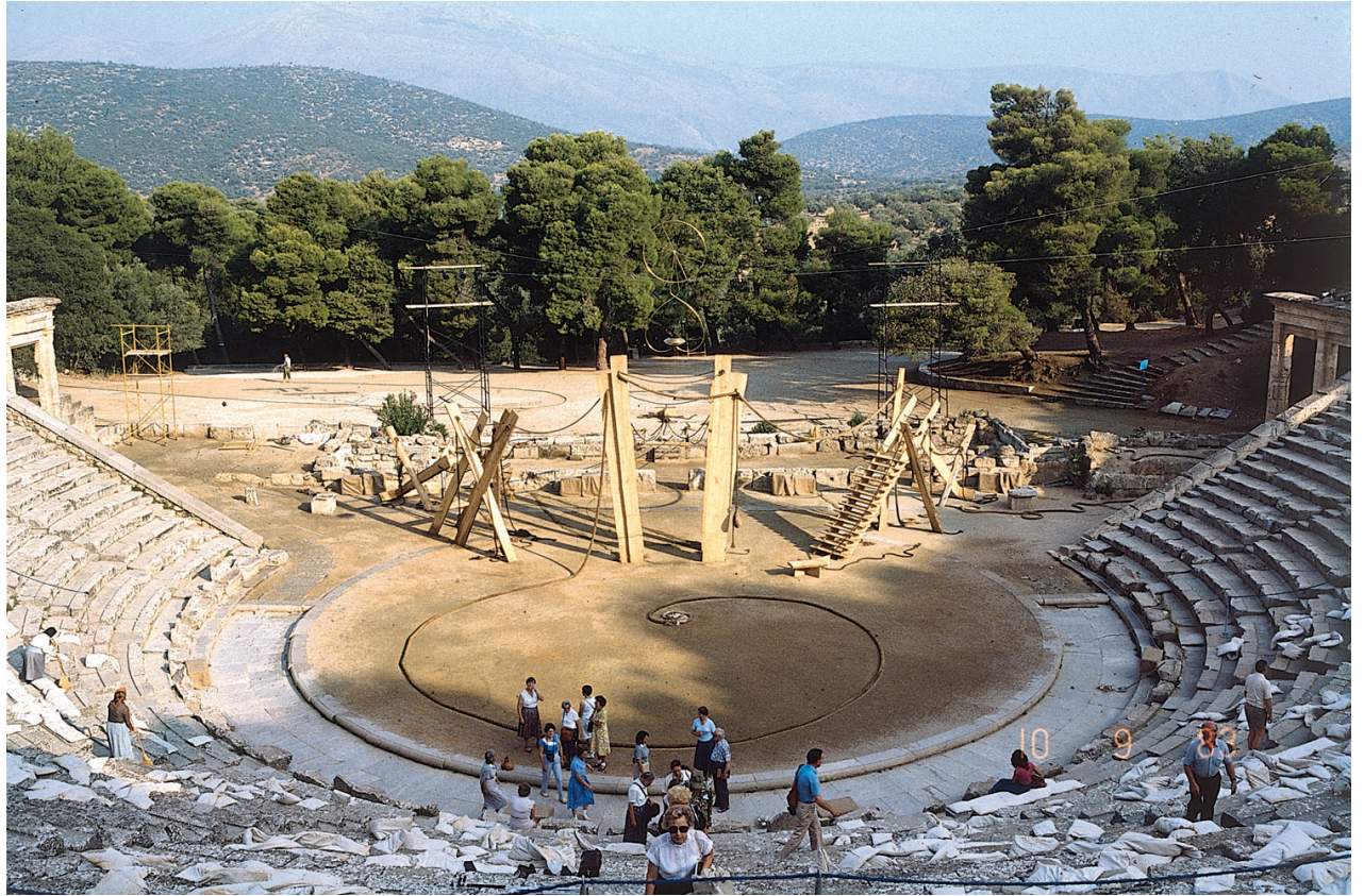
Σκηνικό του Θόδωρου για τις Φοίνισσες , (1983), στο Θέατρο της Επιδαύρου, την ημέρα.