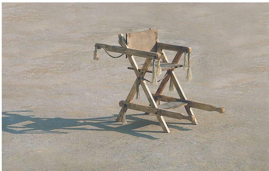
Θρόνος-Φορείο του Οιδίποδα, του Θόδωρου για την παράσταση Φοίνισσες , 1983.